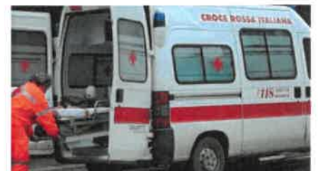
COSENZACHANNEL.IT Si sente male ma l'ambulanza arriva ...

IL DRAMMA | La famiglia della donna originaria di Scandale si è rivolta ai carabinieri per fare luce sulla drammatica vicenda